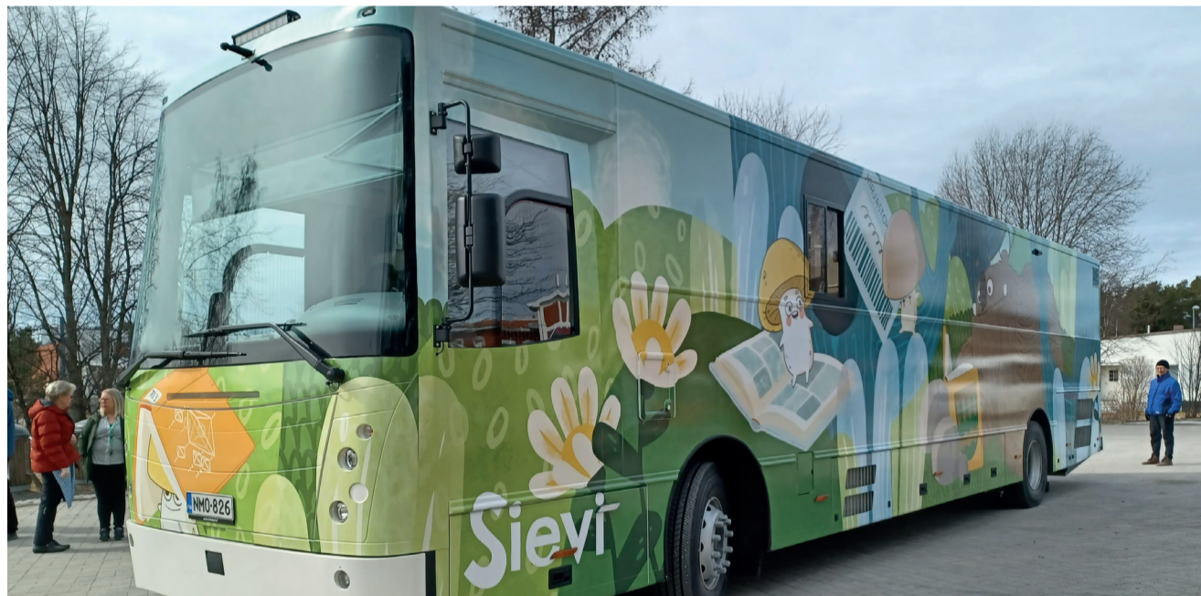
Kirjastoauto Sirppu tuo kirjat sinnekin, mistä on kirjastolle matkaa. Kohta kaksi vuotta täyttävä Sirppu kiertää sivukylien lisäksi kaikilla ala-asteilla. Ehdotuksia tarpeellisten, uusien pysäkkien lisäämisestä voi tehdä suoraan kirjastoautoon tai Sievin kirjastoon.

Kauneimmat joululaulut järjestetään kirjastolla to 12.12. klo 18 yhdessä Sievin seurakunnan kanssa.