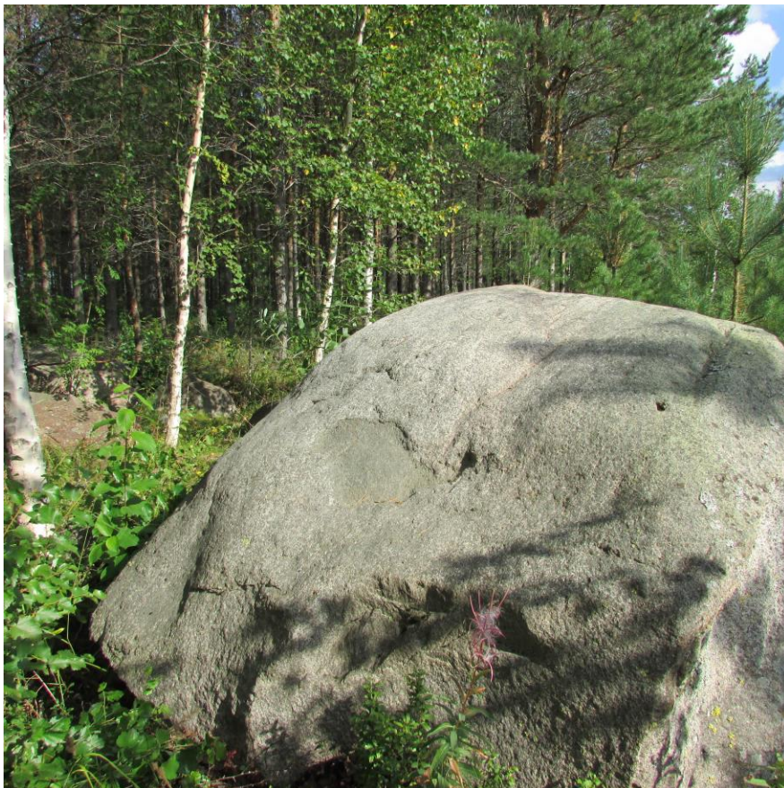
Kuva 1. Suuri irtolohkare, jonka päällä (keskellä kiveä) kuppi sijaitsee. Kiurunkankaan rautakautinen kohde (mj.1000034214) on takana näkyvässä metsikössä keskikoordinaattien mukaan noin 60 metrin päässä. Kiven oikealla puolella (kuvassa) noin parin metrin päässä on vanhan soranottokuopan reuna.