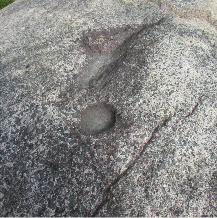
Kuva 2. Kuppi ja sen vieressä oleva pitkänomainen kuppimainen syväne.