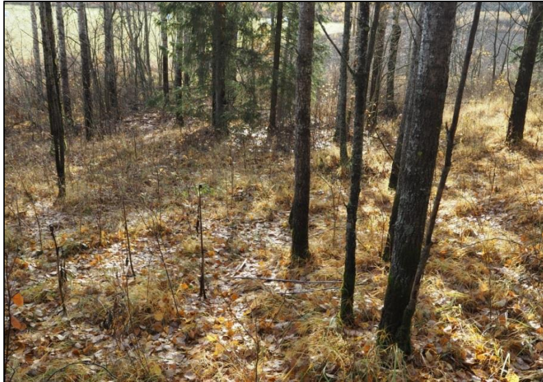
Kuva 2. Näkymä putkikirveen löytöpaikalle.