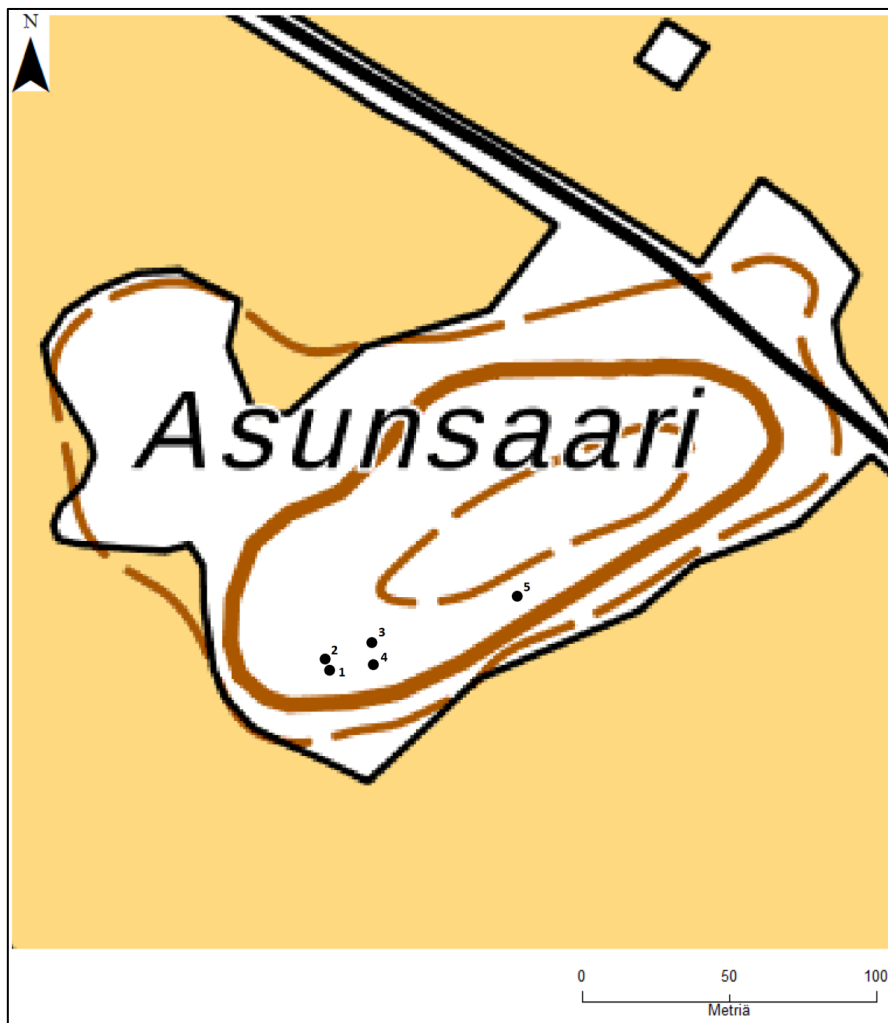
Kuva 1. Asunsaaren löytöjen levintä.

Tarkastushetkellä havainnointiolosuhteet olivat hyvät ja useimmat metallinilmaisinharrastajien kaivamat kohdat olivat selvästi nähtävissä muutoin kajoamattomassa metsämaassa. Löytöjen ja alueen kasvillisuuden perusteella paikalla on ilmeisesti ollut historiallisen ajan pihapiiri ja tätä näkemystä tukee myös kooltaan 5x6 metriä oleva maaperustaisen rakennuksen pohja, joka havaittiin välittömästi löytöpaikan pohjoispuolella. Tämän lisäksi paikalla on nähtävissä muutamia halkaisijaltaan noin yhden metrin olevia kuoppia ja painanteita, jotka näyttävät liittyvän Asunsaaren historiallisen ajan käyttövaiheeseen. Yhtä poikkeusta lukuun ottamatta, Asunsaaren löydöt levittyivät halkaisijaltaan noin 16 metrin laajuiselle alueelle, josta ne on paikannettu välittömästi sammale alta. Löytäjiltä saatujen tietojen perusteella aineisto voidaan sijoitella viiteen toisistaan erillään olevaan kohtaan, joskin useissa tapauksissa löytöpaikkoihin sisältyy huomattavasti epävarmuutta, sillä löytöpaikkoja ei ollut merkitty maastoon. Näin ollen Asunsaaren aineistossa on jonkin verran esineitä, joiden tarkka löytöpaikkaa ei ollut mahdollista dokumentoida. Löytöpaikat sekä niiden tarkemmat kuvaukset esitellään tarkemmin alla. Löytöpaikkojen keskinäinen sijoittuminen on esitetty kuvassa 1 näkyvässä kartassa.