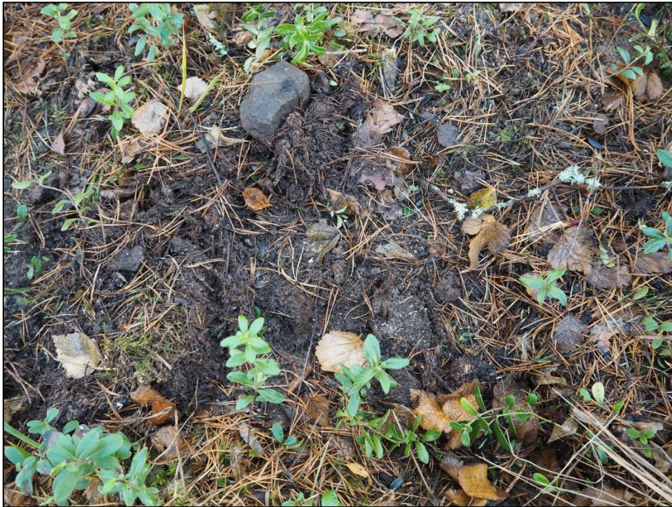
Kuva 3. Löytöpaikka 1. Palaneita luita pintamaan ja huuhtoutumiskerroksen leikkauspinnassa.

Löytöpaikkojen määrittämiseen sisältyy jonkin verran epävarmuutta, sillä löytäjät eivät tarkastushetkellä täysin muistaneet, mitkä esineet oli kaivettu esiin löytöpaikasta 1 ja mitkä löytöpaikasta 2. Tästä huolimatta löytöpaikkojen voidaan todeta sijaitsevan noin kahden metrin etäisyydellä toisistaan, sillä kaivamisen jäljet olivat tarkastushetkellä yhä nähtävissä maastossa. Varmuudella voidaan myös todeta, että vyöhön kuuluneet helat sekä rautainen rengas ovat peräisin näistä lähellä toisiaan olevista paikoista. Ilmeisesti paikalta on kaivettu esiin myös useita kupariseoslevyn kappaleita, mutta näiden tarkkaa sijoittumista löytöpaikoille ei ollut mahdollista selvittää. Löytäjiltä saatujen tietojen mukaan kaikki esineet oli havaittu pintamaan ja huuhtoutumiskerroksen rajapinnassa. Tarkastushetkellä kummassakin yhä avoinna olevassa löytöpaikassa voitiin havaita palaneita luita ja näiden perusteella metallinilmaisinelöydöt edustavat kiinteää muinaisjäännöstä (Kuva 3). Palaneen luun kappaleet jätettiin maahan. Löytöpaikka 1 sijaitsee koordinaateissa x=7090647,433 ; y=377397,809 ; z=80,859 ja löytöpaikka 2 koordinaateissa x=7090645,387 ; y=377397,500 ; z=80,749 .