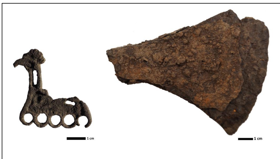
Kuva 1. Kiurunkankaalta löytynyt linturiipus (vas.) ja silmäkirveen katkelma.

Eläinriipus (Kuva 1) on katkelmallinen ja muodoltaan lähinnä yhteen suuntaan katsovaa lintua muistuttava. Esine on litteä ja siinä on nähtävissä kaksi reikää sekä esineen alapinnalla kulkeva viiden kiinnityslenkin sarja. Kiinnityslenkkeihin kuuluneita riipuksia tai vastaavia erillisosia ei aineistossa havaittu. Muodoltaan esine on lähellä itäisiä eläinriipuksia, mutta tarkkaa vastinetta ei löydy ainakaan Pohjois-Suomen rautakautisesta aineistosta, joskin esimerkiksi listä, Sallasta ja Suomussalmelta tunnetaan eläinaiheisia riipuksia 5 . Vyön tai hinnan helat puolestaan ovat koristelemattomia ja muodoltaan nelikulmaisia. Kunkin kääntöpuolella on nähtävissä kaksi pientä niittiä, jolla helat on kiinnitetty paikalleen. Löytökokonaisuuteen kuuluu myös rautainen rengas sekä pieni neula ja näiden perusteella esineet voidaan tulkita kuuluneeksi vyöhön, joka on todennäköisesti ollut samanlainen kuin muun muassa Mikkelin Tuukkalasta dokumentoitu ristiretkiaikainen vyö (Kivikoski 1973: Abb 1195). Kiurunkankaan kirveet edustavat kahta eri aikakautta, joskin silmäkirveen (Kuva 1) ajoittaminen on haastavaa sillä esineen kiinnitysosa on irronnut. Kyseessä lienee todennäköisimmin myöhäiselle rautakaudelle ajoittuva ja sangen leveäteräinen kirves, joskaan tarkempi tyyppittely ei ole mahdollista. Putkikirves puolestaan edustaa varhaisempaa aikakautta kuuluu todennäköisesti joko Kansainvaellus- tai Merovingiajalle.